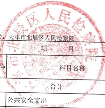
收入决算表(按功能分类列示)